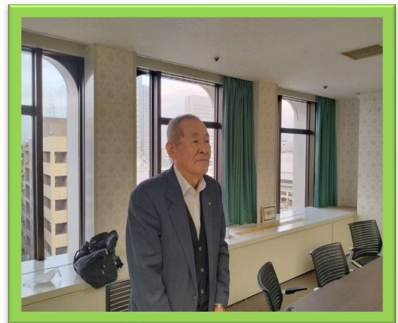
貨物鉄産労退職者連絡会前村会長

11月28日、都内において第11回貨物鉄産労退職者連絡会総会を開催し、今後の取り組み方針を満場一致で可決しました。